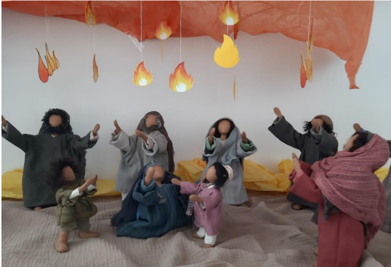
Pfingstkrippe in St. Martin, Mai 2024